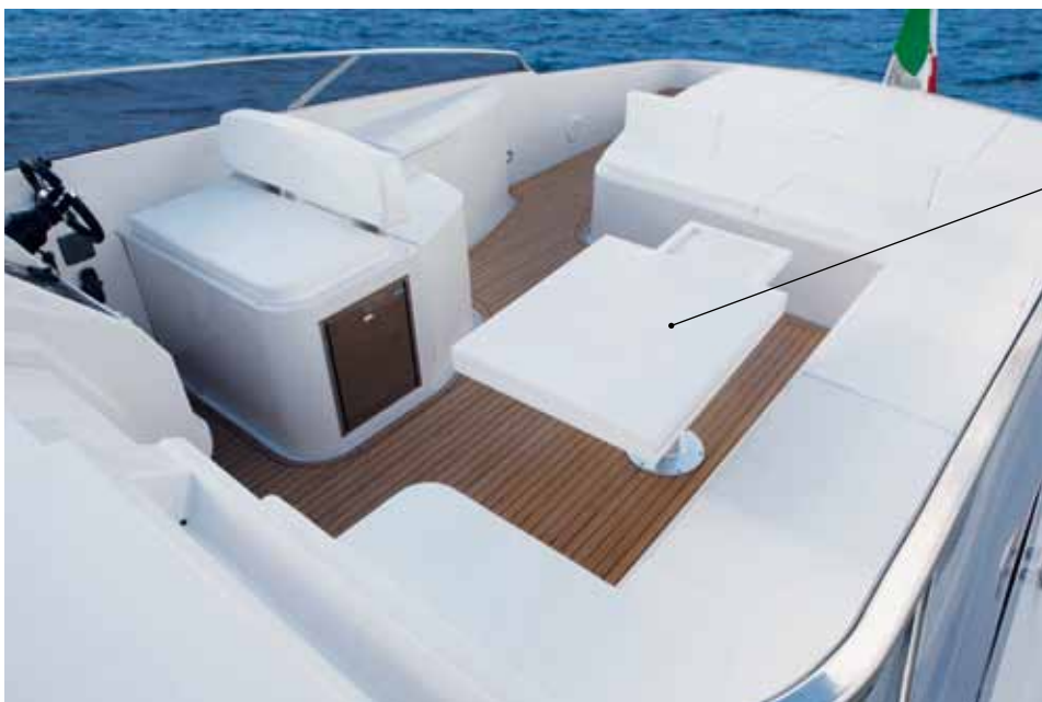
Il pozzetto esterno, che ospita fino a otto persone, è dotato di un tavolo a ribalta con piccoli e comodi dettagli / The exterior cockpit that hosts up to eight people, boasts a folding table with small and comfortable details